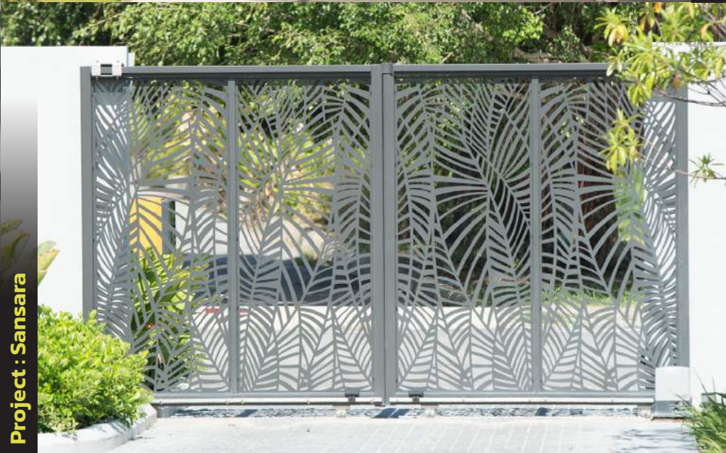
Project : Sansara