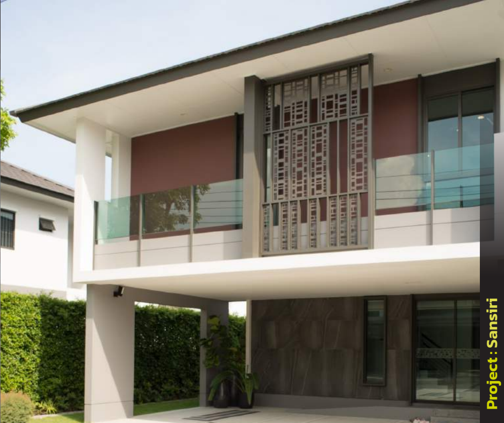
Project : Sansiri